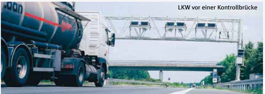
LKW vor einer Kontrollbrücke

berechnung. Dabei hat sich der Anteil von ausländischen Fahrzeugen mit On-Board Units auf 42 Prozent weiter erhöht (Vorjahr: 38 Prozent). Qualitativ arbeitet das Mautsystem mit hoher Präzision. Dafür spricht die hohe Verfügbarkeit im automatischen System. Sie liegt seit 2006 konstant bei durchschnittlich 99,75 Prozent und übertrifft damit den im Betreibervertrag festgelegten Wert von 99 Prozent. Die Kosten für den Betrieb des Mautsystems wurden in den vergangenen Jahren kontinuierlich reduziert und liegen jetzt bei rund 12 Prozent der Mauteinnahmen. www.toll-collect.com