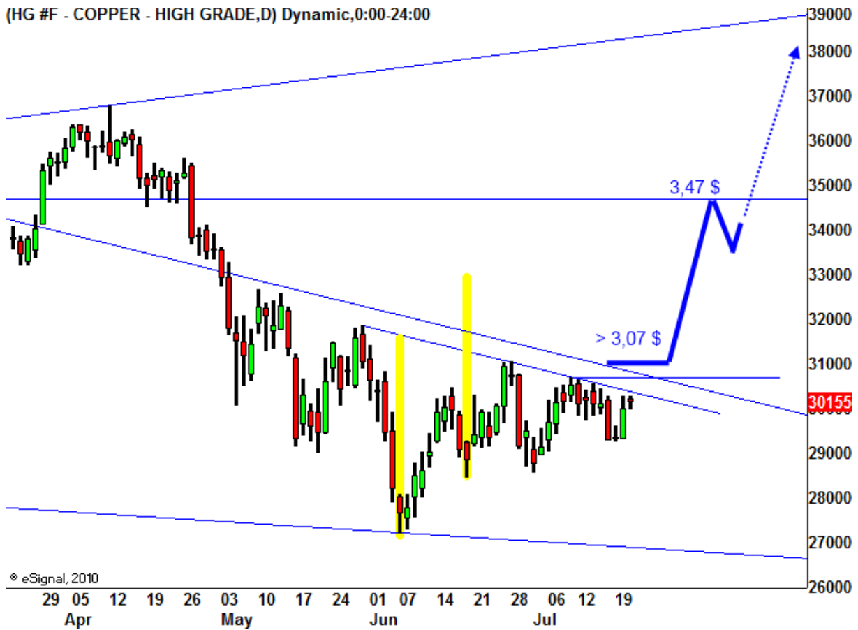
(HG #F - COPPER - HIGH GRADE,D) Dynamic,0:00-24:00